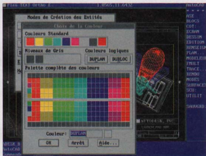
Autocad 12 contient 174 nouvelles fonctions.

Le marché de la CFAO est en pleine mutation. La vague de concentrations déferle, les petits éditeurs connaissent de graves difficultés, et les survivants doivent satisfaire les besoins spécifiques des bureaux d'études, leur apporter des fonctions évoluées et davantage de logiciels par métier.