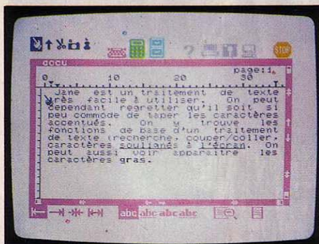
Le traitement de texte de Jane ne permet d'afficher que 37 caractères en même temps à l'écran.