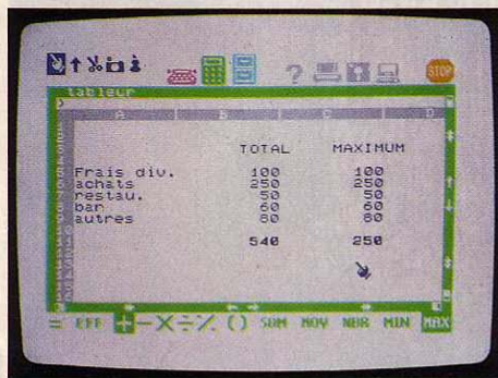
Le tableur de Jane permet d'effectuer des opérations simples.